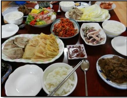
Traditionelles koreanisches Abendessen

Und hier sitze ich nun also, nach 4 Monaten voller Erfahrungen in einer ganz neuen Welt, habe gerade meine letzten Prüfungen für dieses Semester absolviert und in ein paar Tagen packe ich bereits meine Koffer und breche Richtung Österreich auf, während ihr wahrscheinlich gerade im vorweihnachtlichen Test- und Schularbeitenstress versinkt und bei so manchen ProfessorInnen versucht eine „Weihnachtsstunde“ rauszuschlagen – viel Glück dabei!