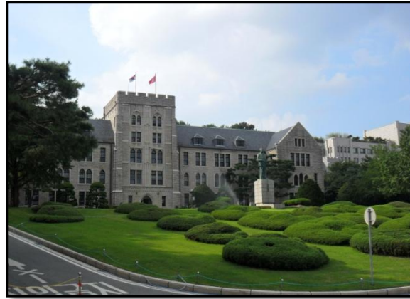
Korea University -Hauptgebäude

Drei Innsbrucker StudentInnen sind also ausgezogen, um an drei verschiedenen Koreanischen Universitäten zu studieren und ich habe mich für die prestigeträchtigste der zur Auswahl stehenden Unis in Korea entschieden, die Korea University (KU) in der Hauptstadt Seoul. Eine der drei Top-Unis des Landes und das spürt man auch. Ein mächtiger Campus voll von noch mächtigeren und efeumrankten Gebäuden in denen die