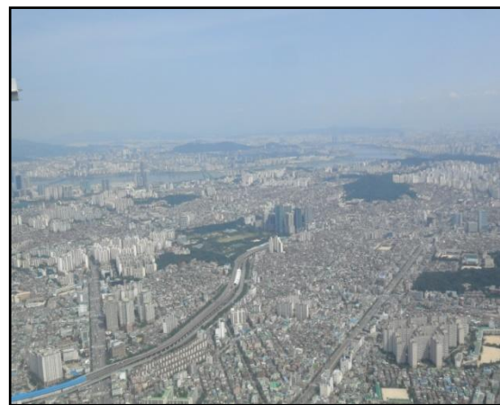
Ausblick über einen kleinen Teil Seouls

inskribiert und das mach ich auch nach nun schon 7 Semestern noch. Im Februar habe ich bereits ein wenig studentische Auslandserfahrung in den USA geschnuppert und dort an einem Kurzstudienprogramm teilgenommen und während dieser 4 Wochen auch erkannt, wie großartig diese Erfahrung sein kann und habe mich deshalb auch schon auf das bereits geplante Auslandssemester in London im Herbst gefreut. Na und dann kam alles anders. Es flatterte ein E-Mail herein, in dem ein ganz neues Austauschprogramm nur für LehramtstudentInnen (das einzige und erste seiner Art) beworben wurde, welches speziell von der EU gefördert wird und eine Austausch von StudentInnen dreier europäischer Unis (Finnland, Estland, Österreich) und dreier koreanischen Unis darstellt. Ehrlich gesagt, ich hab' nicht allzulange überlegt. Da nur drei StudentInnen der Uni Innsbruck geschickt wurden, habe ich meine Chancen nicht sehr hoch geschätzt und mich einfach auf gut Glück beworben. Wie ihr euch nun denken könnt, da ich diese Zeilen ja