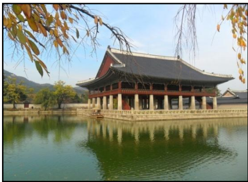
Traditioneller koreanischer Palast

Das gleiche gilt auch für die Schule. Koreanische SchülerInnen verbringen mehr als 12 Stunden pro Tag in der Schule (kurioser Nebeneffekt: dafür dürfen sie während des Unterrichts schlafen) und lernen. Lernen wirklich! Denn alles dreht sich um den wichtigsten Tag in ihrem Leben, der Tag, des Aufnahmetests für die Uni. An diesem Tag werden 6 Fächer in 6 Stunden abgeprüft. Das ganze Land steht still, alle SchülerInnen des Abschlussjahrgangs im ganzen Land schreiben zur gleichen Zeit exakt die gleiche Prüfung. Eine Prüfung, dessen Punkteanzahl entscheidet, was und wo die SchülerInnen in Zukunft studieren werden.